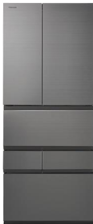
冷凍冷蔵庫「VEGETA」 FZS シリーズ

聞こえサポート商品などを手掛けるオトモア株式会社（所在地 東京都千代田区、代表取締役 百足敏治）（以下オトモア）は、東芝ライフスタイル株式会社（所在地 神奈川県川崎市、代表取締役 社長執行役員 小林伸行）（以下東芝ライフスタイル）が 2 月中旬より発売する冷凍冷蔵庫「VEGETA」 ※1 の「FZS シリーズ」 3 機種（GR-W600FZS/GR-W550FZS/GR-W510FZS）に当社開発の Bluetooth®スピーカーアンプモジュールが採用されましたのでお知らせいたします。